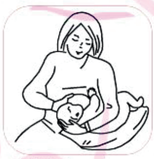
Koltuk Altı Pozisyonu