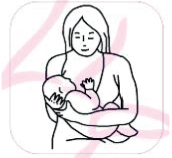
Ters Kucak Pozisyonu